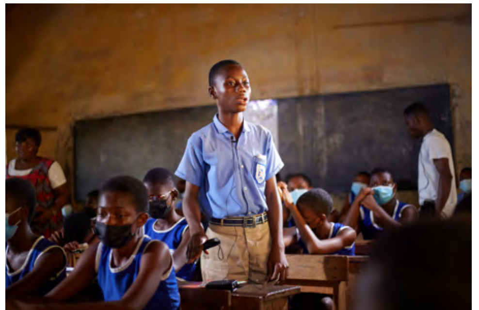
Kinderen leren voor zichzelf op te komen en te spreken in het openbaar.

Met elke familie wordt een persoonlijk en haalbaar familie-ontwikkelingsplan opgesteld. Een plan dat uitgaat van hun sterke punten én de uitdagingen blootlegt. Uitdagingen die ze het hoofd moeten bieden om hun kinderen te beschermen en goed te kunnen verzorgen. Ouders, grootouders, ooms en tantes dragen binnen het plan zelf verantwoordelijkheid voor hun ontwikkeling, om zo duurzame verandering in hun leven mogelijk te maken. Het uiteindelijke doel: weer zelfredzaam zijn en hun kinderen de zorg, bescherming, aandacht en begeleiding kunnen bieden die ze nodig hebben.