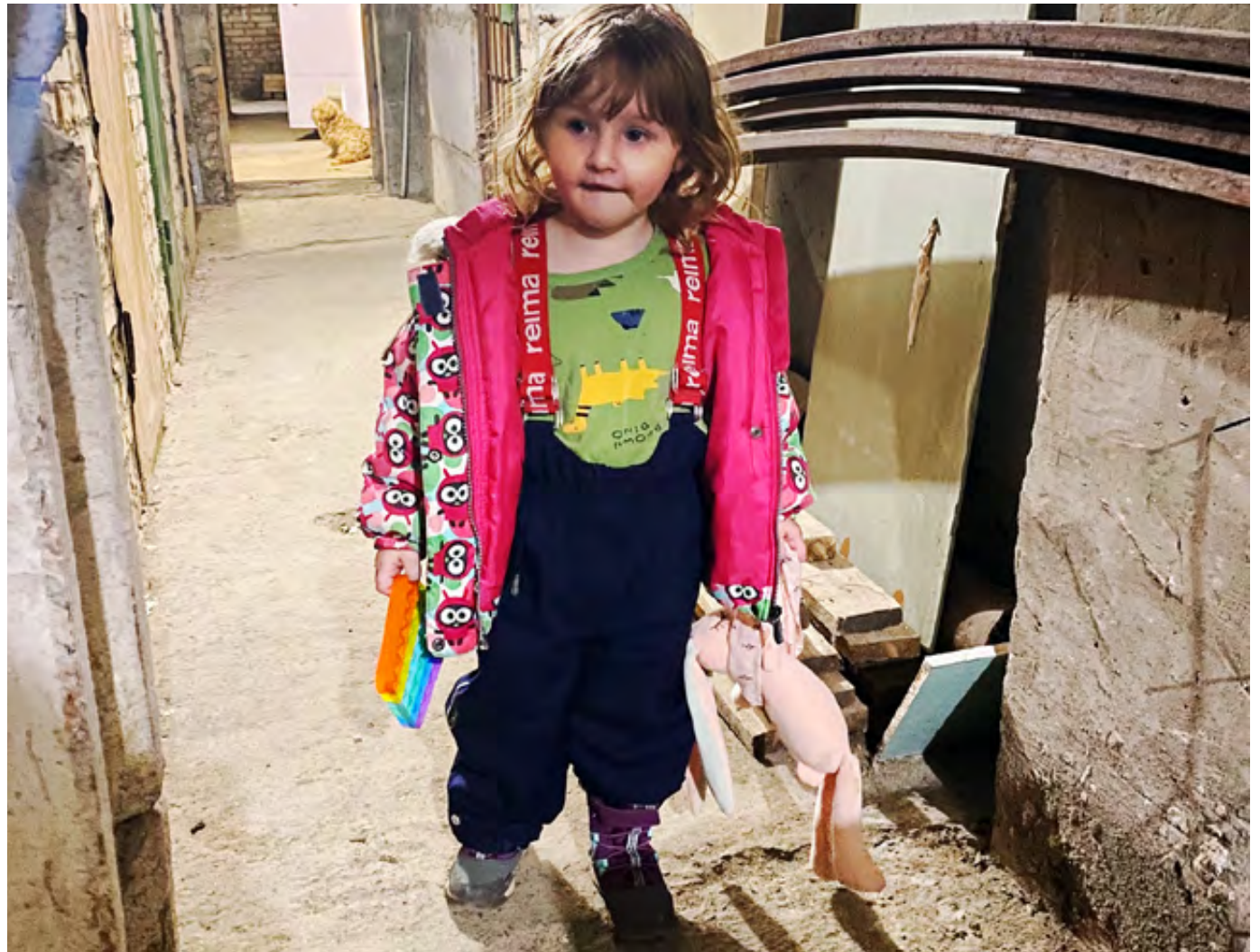
Gevluchte kinderen uit Oekraïne kunnen zich op de opvang weer veilig voelen. Hier krijgen ze psychosociale hulp.

TEKST: LINDA SMOLDERS