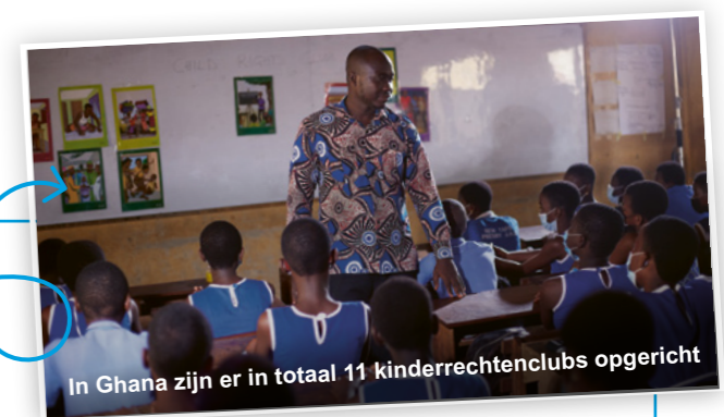
In Ghana zijn er in totaal 11 kinderrechtenclubs opgericht

sinds de oprichting van deze kinderrechtenclubs. Ook is het zelfvertrouwen van de leerlingen toegenomen en zijn hun leerprestaties sterk verbeterd. Door het grote succes organiseert SOS Kinderdorpen deze kinderrechtenclubs inmiddels in vijf gemeenten in Ghana.